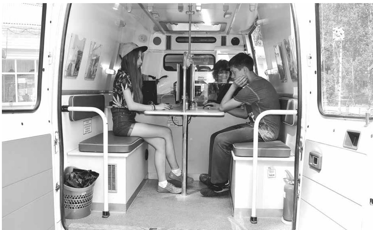
Летом мобильный офис центра занятости выезжает в детские загородные лагеря.

Формы работы со школьниками совершенствуют. Впервые 528 учеников 7-10 классов из городов и районов РТ побывали в детском городе профессий «Кидспейс». Третий год центры занятости предлагают свои